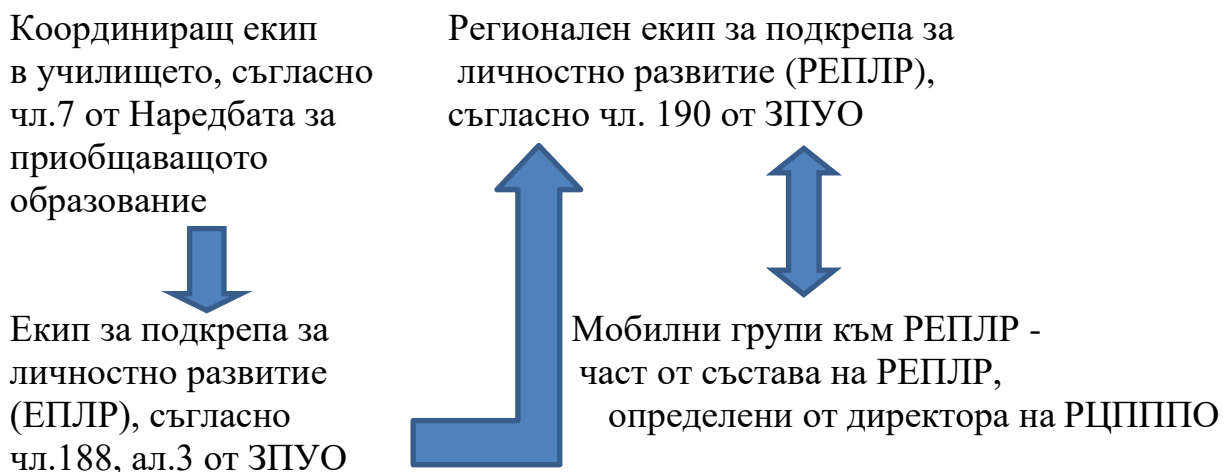
Схема 2: Механизъм на одобрение на оценката на Екип за подкрепа за личносно развитие (ЕПЛР)

В тридневен срок од До два дни, Мобилната група